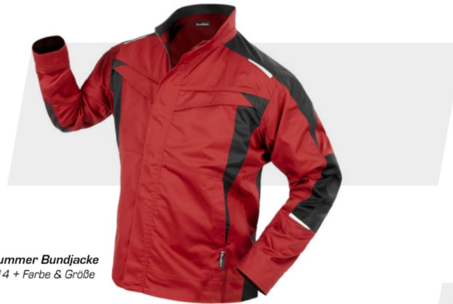
Artikelnummer Bundjacke NM-43014 + Farbe & Größe

Moderne Bundjacke in dynamischem Design. Verdeckter Reißverschluss. 2 Brusttaschen mit Patte und Reißverschluss, 2 seitliche Einschubtaschen. 1 Brust-Innentasche mit integrierter Stifftasche, zusätzliche Innentasche im vorderen Saumbereich. Elastische Einsätze im Rückenteil und an den Seiten. Innenliegendes Strickbündchen am Ärmelsaum. Signature-Reflexelemente an der Schulterpasse, den Ellenbogen und im Rückenteil. Bund im Rücken verlängert.